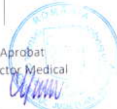
TABEL CU GARZILE MEDICILOR LUNA Iunie 2018