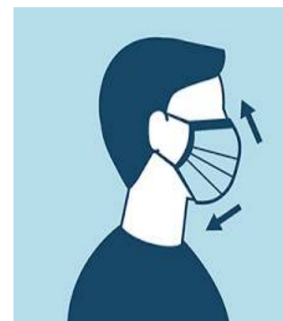
DOs AND DON'Ts OF WEARING A MASK